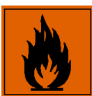
F - Fácilmente inflamable