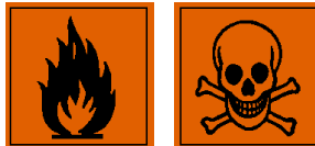
F - Licht ontvlambaar