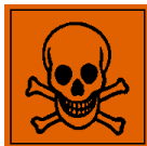
T - Giftig

R-zinnen : R45 - Kan kanker veroorzaken S-zinnen : S36 - Draag geschikte beschermende kleding S45 - In geval van ongeval of indien men zich onwel voelt, onmiddellijk een arts raadplegen (indien mogelijk hem dit etiket tonen) S53 - Blootstelling vermijden - voor gebruik speciale aanwijzingen raadplegen S23 - Smitnevel niet inademen S28 - Na aanraking met de huid onmiddellijk wassen met veel water. S35 - Deze stof en de verpakking op veilige wijze afvoeren S23 - Damp niet inademen S23 - Rook niet inademen Extra zinnen : Uitsluitend voor industrieel en beroepsmatig gebruik